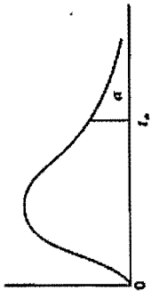
Table A.6* Critical Values of the F-Distribution